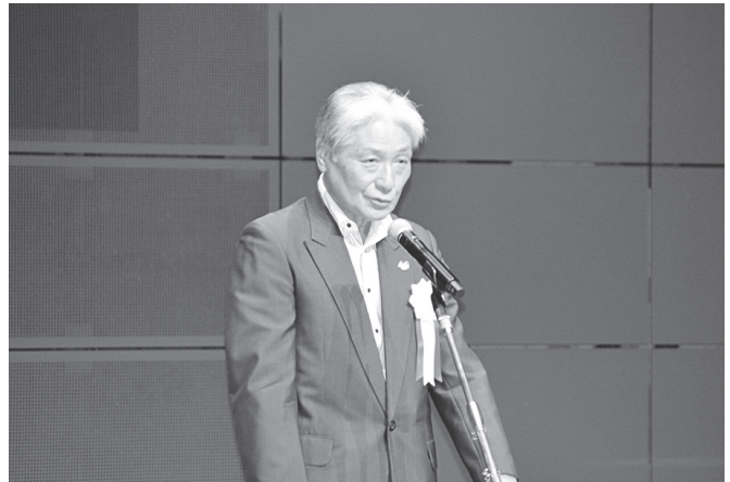
開会式・知事挨拶