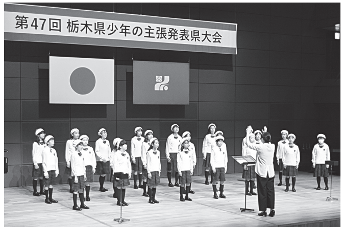
ミニコンサート（宇都宮少年少女合唱団）