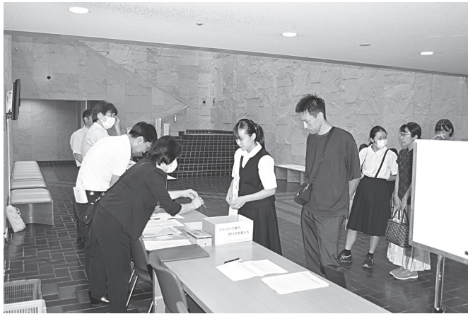
発表者受付の様子